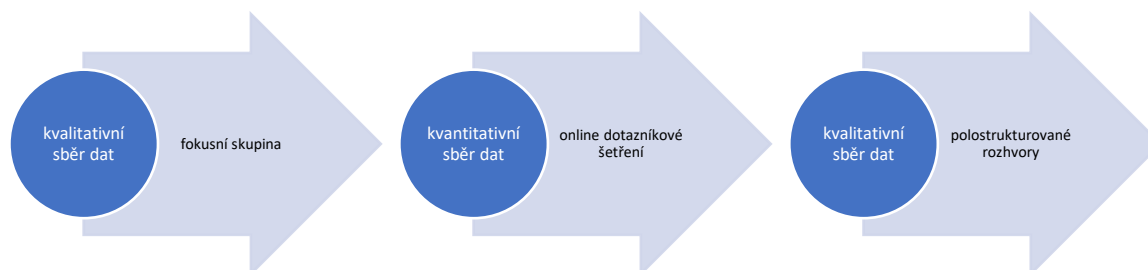
Schéma č. 1 Schéma sekvenční triangulace použitých metod a technik sběru dat

Sekvenční způsob kombinace použitých kvalitativních a kvantitativních metod byl záměrný a použitým metodám sběru dat nebyl přisuzován žádný vztah podřazenosti. Navazující kvalitativní část dotazováním prohlubuje poznatky získané dotazníkovým šetřením (Hendl, 1997).