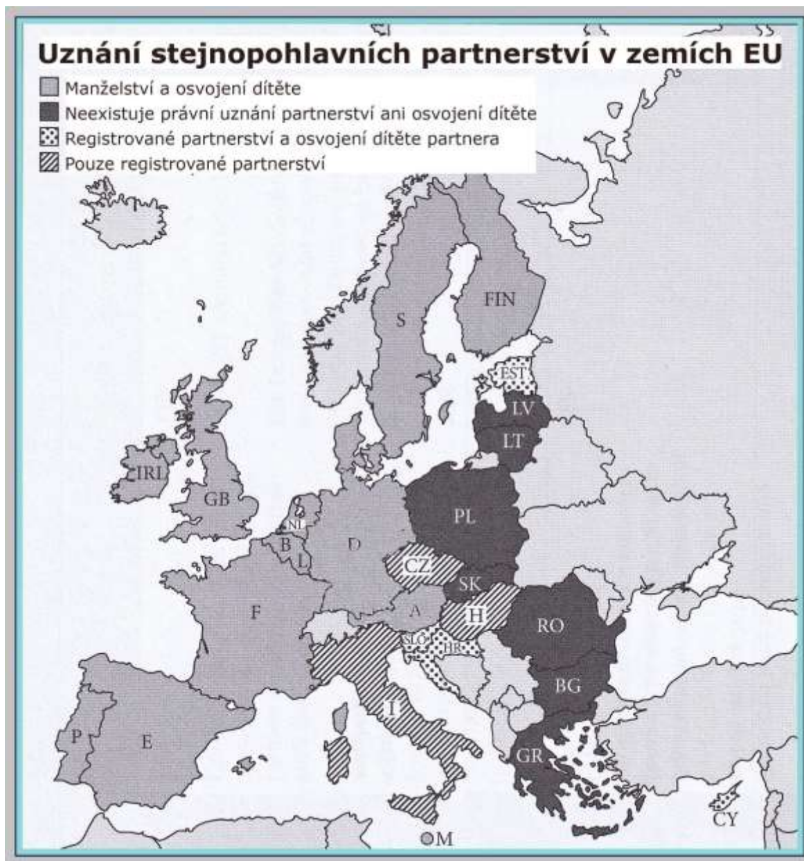
Obrázek č. 3 Právní uznání stejnopohlavních partnerství a osvojení dítěte v EU